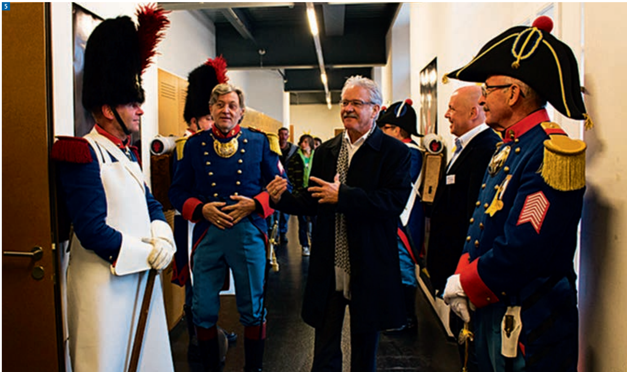
5. Visite de l'exposition par Monsieur le Conseiller d'Etat, B at Vonlanthen.