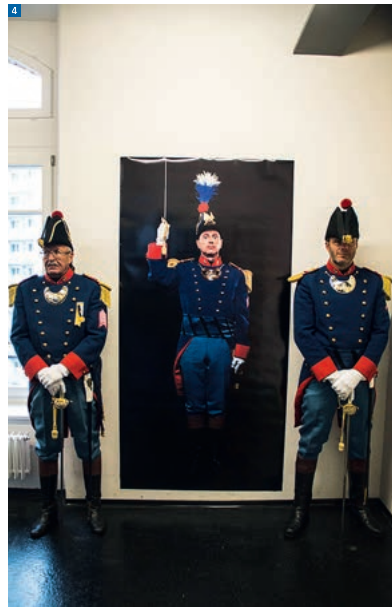
4. Cherchez l'intrus?