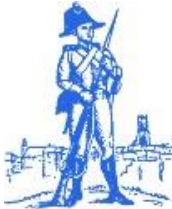
Table des matières (rédigée en 2023)