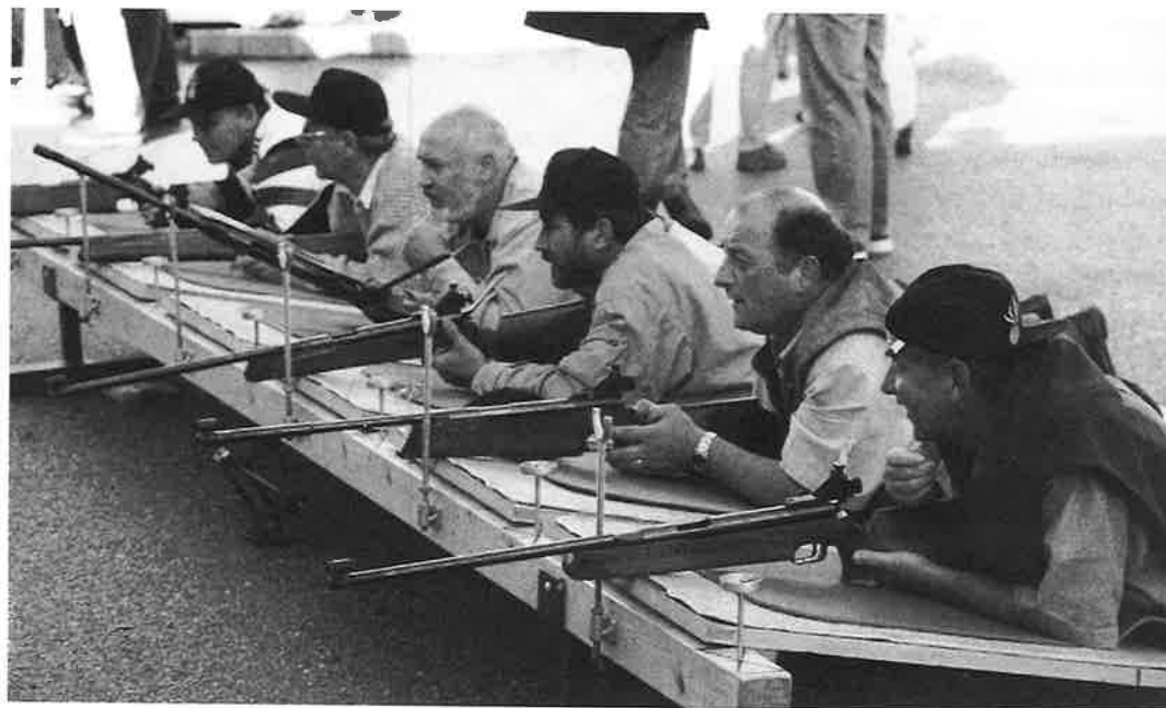
En pleine concentration!