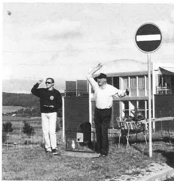
Le sens est bon!