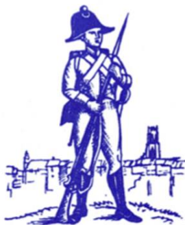
TABLE DES MATIÈRES (rédigée en 2022)